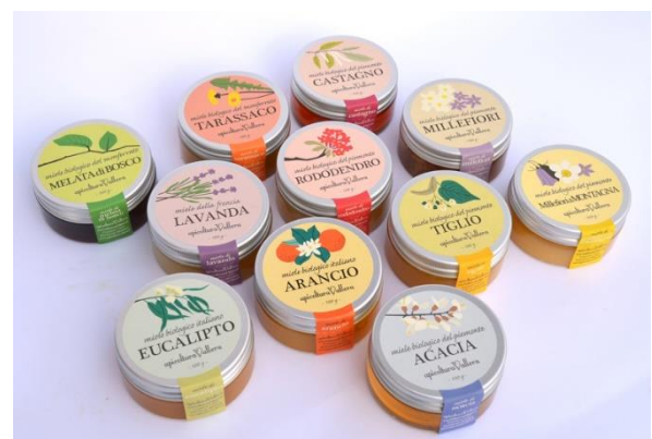
Foto unità di consumo